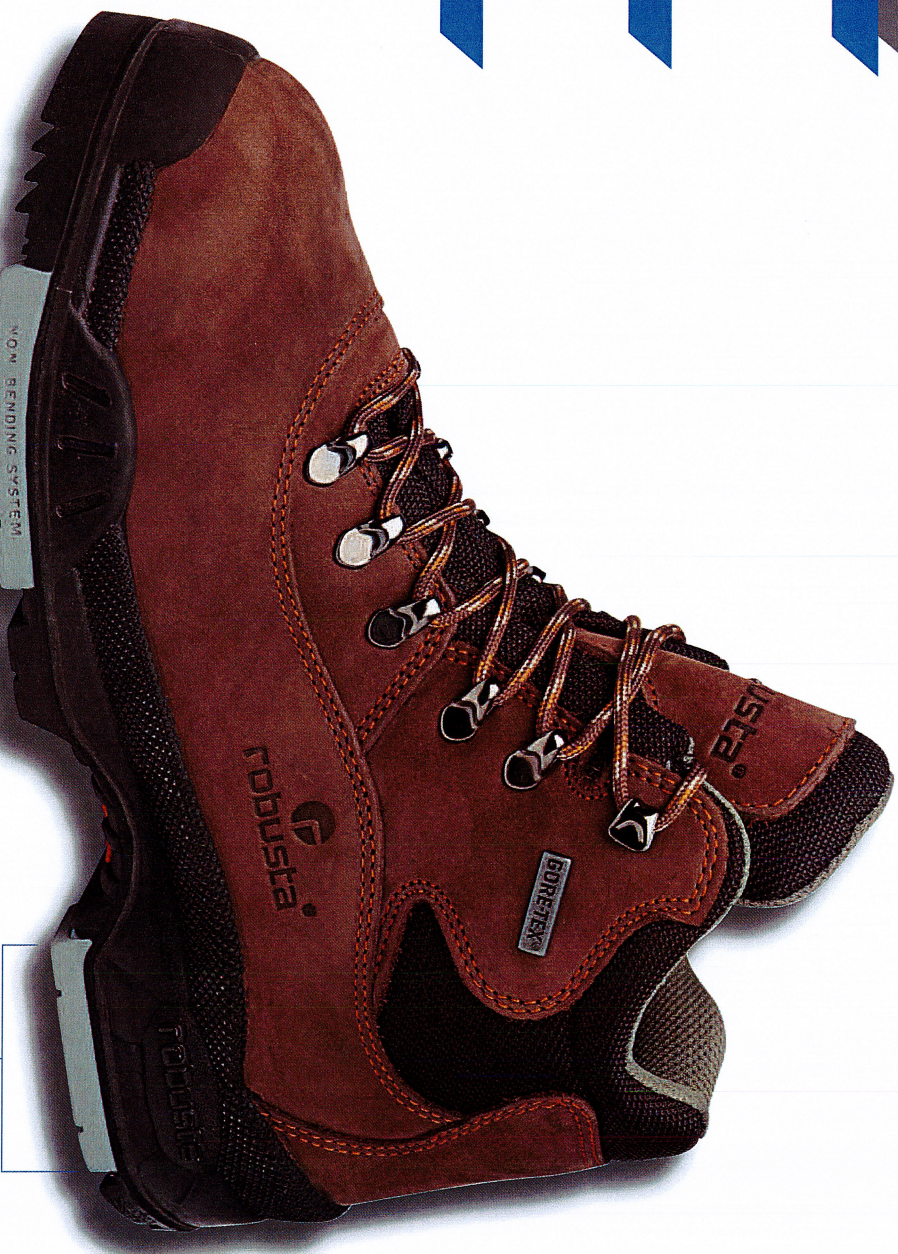
Sistema antitorción Non bending system